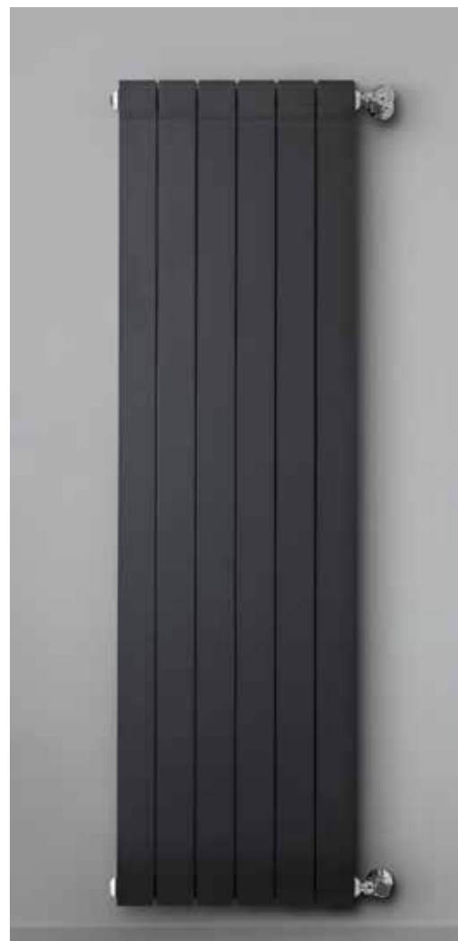
CLASSIC: BLACK COFFEE